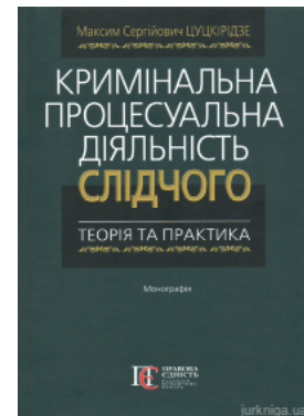
Кримінальна процесуальна діяльність слідчого: теорія та практика