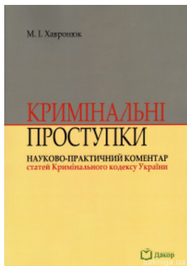
Кримінальні проступки: науково-практичний коментар статей Кримінального кодексу України. Видання третє