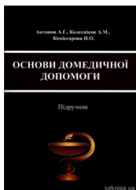
Основи домедичної допомоги. Підручник