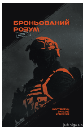
Броньований розум. Бойовий стрес та психологія екстремальних ситуацій