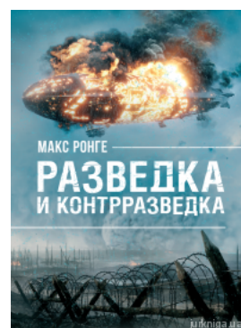
Разведка и контрразведка

Перейти до галузі права Кримінальне право та процес