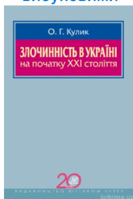
Злочинність в Україні на початку XXI століття