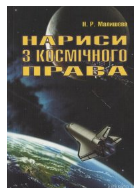
Нариси з космічного права