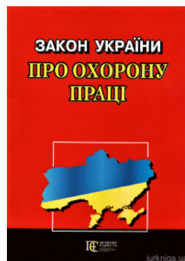
Закон України "Про охорону праці". Алерта