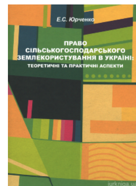
Право сільськогосподарського землекористування в Україні: теоретичні та практичні аспекти