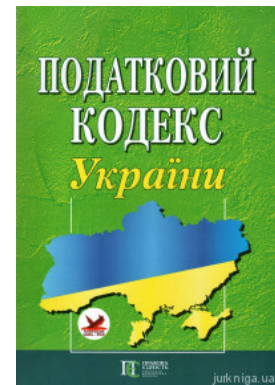
Податковий кодекс України. Алерта