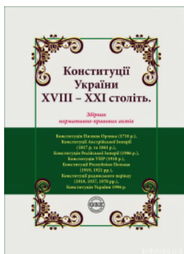
Конституції України XVIII – XXI століть: збірник нормативно-правових актів