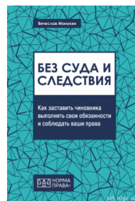
Без суда и следствия