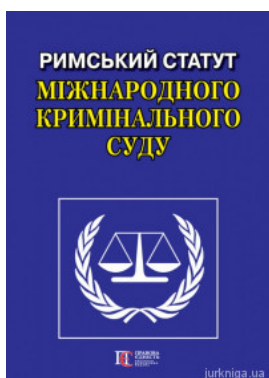
Римський Статут Міжнародного кримінального суду. Алерта