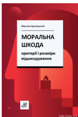
Моральна шкода: критерії і розміри відшкодування