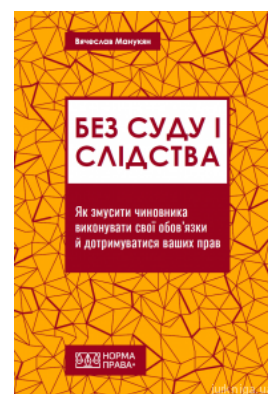
Без суду і слідства

Перейти до галузі права Кримінальне право та процес