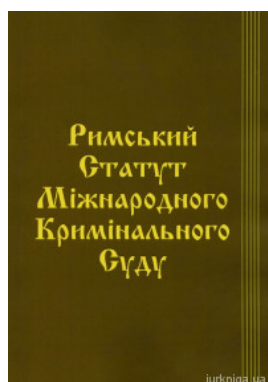
Римський Статут Міжнародного кримінального суду. Паливода