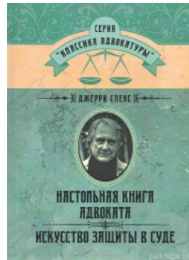
Настольная книга адвоката. Искусство защиты в суде