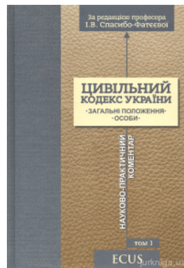
Цивільний кодекс України. Науково-практичний коментар. Том 1. Загальні положення. Особи