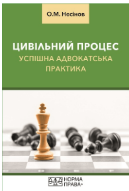
Цивільний процес. Успішна адвокатська практика