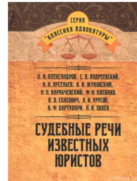
Судебные речи известных юристов