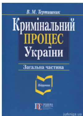
Кримінальний процес України. Загальна частина