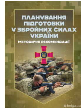
Планування підготовки у Збройних Силах України