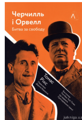
Черчилль і Орвелл. Битва за свободу