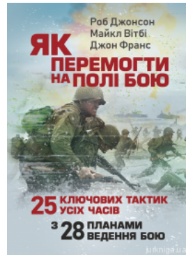
Як перемогти на полі бою. 25 ключових тактик усіх часів. 3 28 планами ведення бою