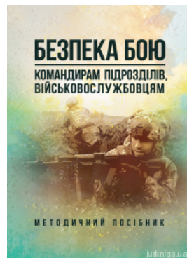
Безпека бою (командирам підрозділів, військовослужбовцям)