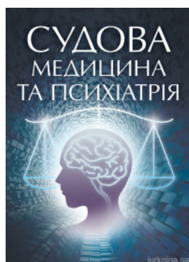
Судова медицина та психіатрія