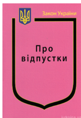
Закон України "Про відпустки"