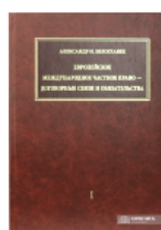
Европейское международное частное право — договорные связи и обязательства (2 тома)