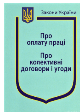
Закони України "Про оплату праці", "Про колективні договори і угоди"

Перейти до галузі права Міжнародне право