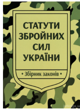
Статuti збройних сил України: збірник законів