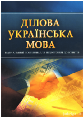
Ділова українська мова. Навчальний посібник для підготовки до іспитів