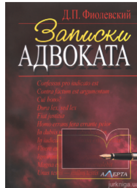
Записки адвоката: рассказы