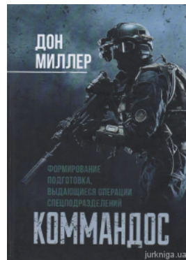
Командос. Формирование, подготовка, выдающиеся операции спецподразделений