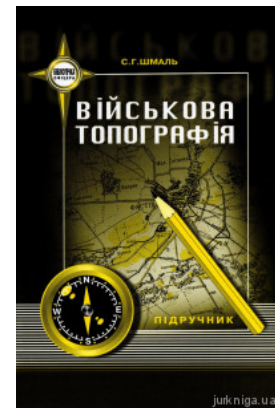
Військова топографія. Підручник