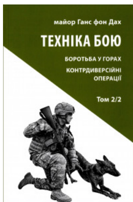
Техніка бою. Боротьба у горах. Контрдиверсійні операції. Том 2. Частина 2