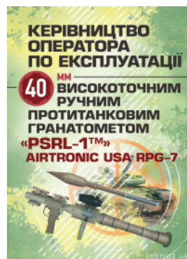
Керівництво оператора по експлуатації 40мм високоточним ручним протитанковим гранатометом «PSRL-1» AIRTRONIC USA PRG-7