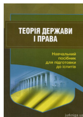
Теорія держави і права. Навчальний посібник для підготовки до іспитів