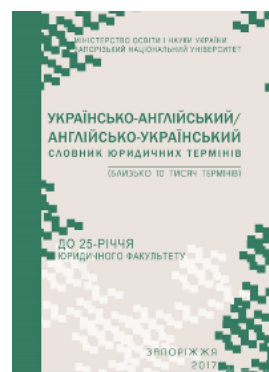
Українсько-англійський / англійсько-український словник юридичних термінів: близько 10 тис. термінів

Перейти до галузі права Конституційне право