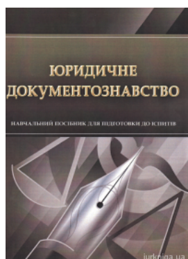
Юридичне документознавство. Навчальний посібник для підготовки до іспитів