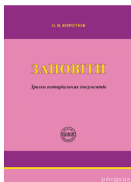
Заповіти: зразки нотаріальних документів