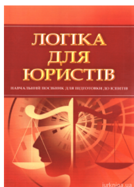
Логіка для юристів. Навчальний посібник для підготовки до іспитів