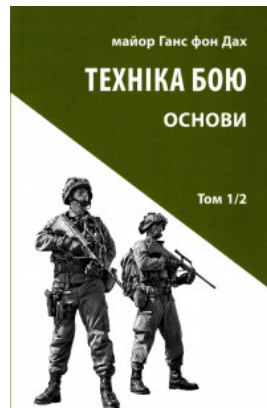
Техніка бою. Основи. Том 1. Частина 2