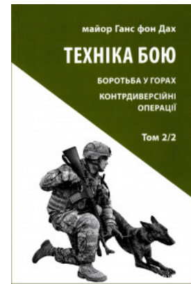
Техніка бою. Боротьба у горах. Контрдиверсійні операції. Том 2. Частина 2