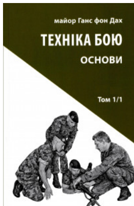
Техніка бою. Основи. Том 1. Частина 1