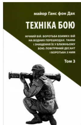
Техніка бою. Нічний бій. Боротьба взимку. Бій на водних перешкодах. Танки і знищення їх у ближньому бою. Повітряний десант і боротьба з ним. Том 3