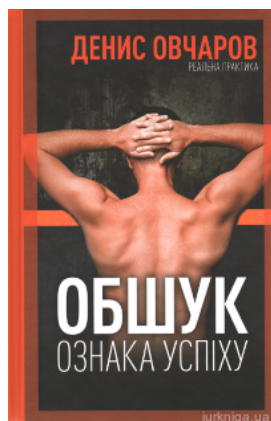
Обшук - ознака успіху