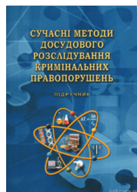
Сучасні методи досудового розслідування кримінальних правопорушень