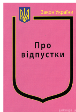
Закон України "Про відпустки"