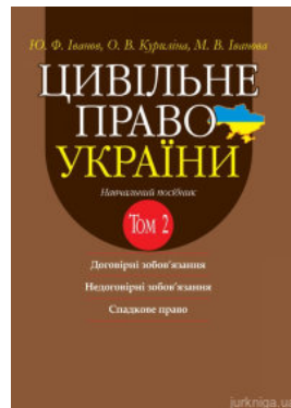
Цивільне право України. Том 2. Навчальний посібник у 2 томах. Видання 2-ге доповнене і перероблене