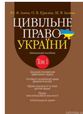
Цивільне право України. Том 1. Навчальний посібник у 2 томах. Видання 2-ге доповнене і перероблене