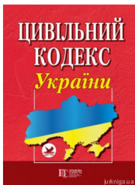
Цивільний кодекс України. Алерта