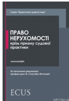
Право нерухомості крізь призму судової практики