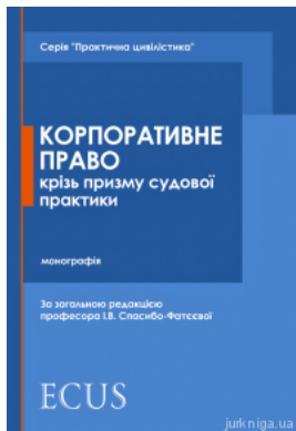
Корпоративне право крізь призму судової практики