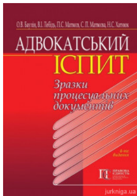
Адвокатський іспит: зразки процесуальних документів