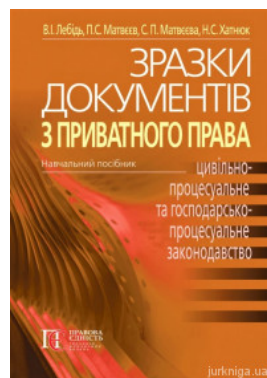
Зразки документів з приватного права (цивільне, сімейне, житлове, трудове, земельне, цивільно-процесуальне та госпо-дарсько-процес уальне...