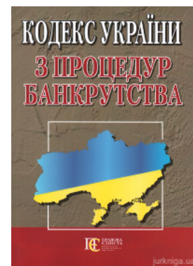
Кодекс України з процедур банкрутства. Алерта

Перейти до галузі права Цивільне право та процес