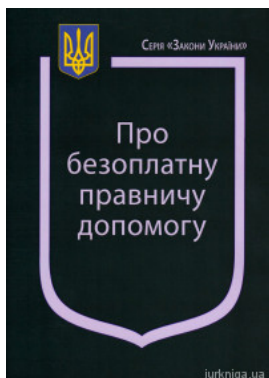
Закон України "Про безоплатну правничу допомогу"