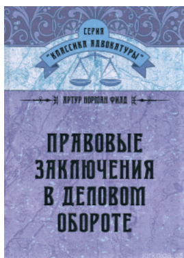
Правові закінчення в деловому обороті