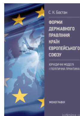
Форми державного правління країн Європейського Союзу: юридичні моделі і політична практика

Перейти до галузі права Цивільне право та процес