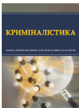
Криміналістика. Навчальний посібник для підготовки до іспитів