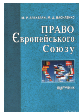
Право Європейського союзу: підручник для студентів вищих навчальних закладів