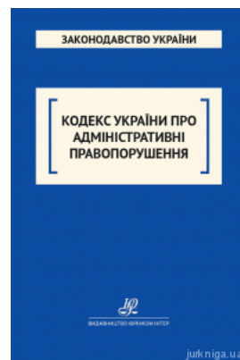
Кодекс України про адміністративні правопорушення. Юрінком Інтер

Перейти до галузі права Цивільне право та процес