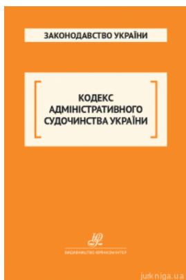
Кодекс адміністративного судочинства України. Юрінком Інтер