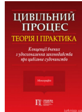
Цивільний процес: теорія і практика. Концепції вчених з удосконалення законодавства про цивільне судочинство