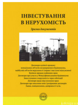
Інвестування в нерухомість: зразки документів