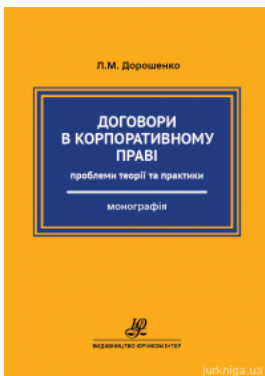
Договори в корпоративному праві: проблеми теорії та практики