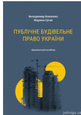
Публічне будівельне право України