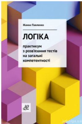
Логіка: практикум з розв'язання тестів на загальні компетентності