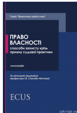
Право власності. Способи захисту крізь призму судової практики