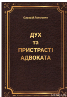
Дух та пристрасті адвоката