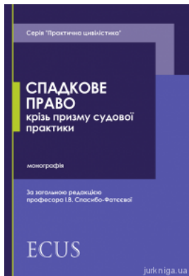
Спадкове право крізь призму судової практики