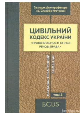
Цивільний кодекс України. Науково-практичний коментар. Том 3. Право власності та інші речові права