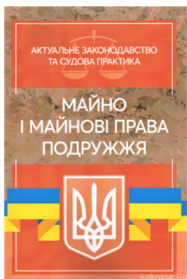
Майно і майнові права подружжя. Актуальне законодавство та судова практика