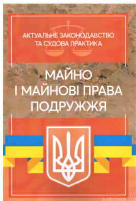
Майно і майнові права подружжя. Актуальне законодавство та судова практика