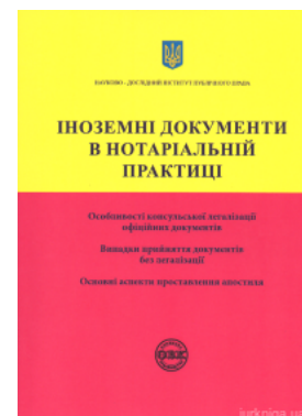
Іноземні документи в нотаріальній практиці

Перейти до галузі права Гражданское право и процесс