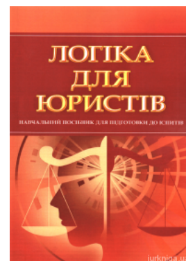
Логіка для юристів. Навчальний посібник для підготовки до іспитів

Перейти до галузі права Ділове письмо та етика