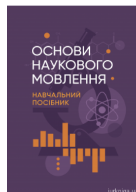
Основи наукового мовлення: навчальний посібник