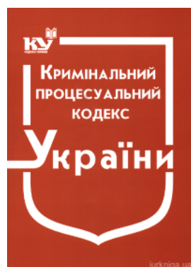
Кримінальний процесуальний кодекс України