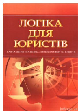
Логіка для юристів. Навчальний посібник для підготовки до іспитів