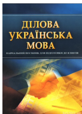
Ділова українська мова. Навчальний посібник для підготовки до іспитів