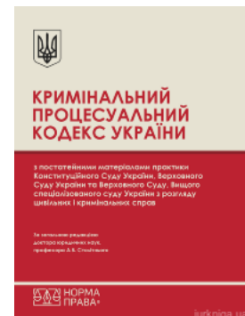
Кримінальний процесуальний кодекс України з постійними матеріалами практики Конституційного Суду України, Верховного Суду України та Верховного...

Перейти до галузі права Цивільне право та процес