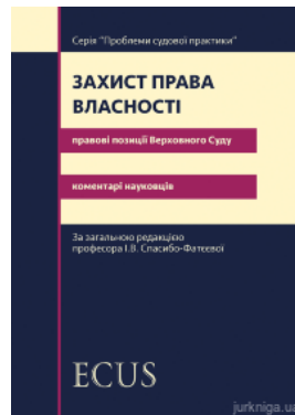
Захист права власності. Правові позиції Верховного Суду: коментарі науковців