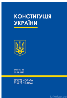
Конституція України. Норма права