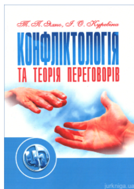
Конфліктологія та теорія переговорів. Навчальний посібник