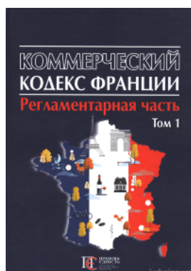
Коммерческий кодекс Франции. Регламентарная часть. Том 1