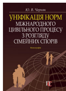
Уніфікація норм міжнародного цивільного процесу з розгляду сімейних спорів