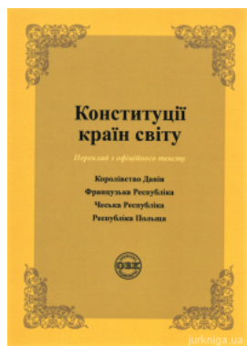
Конституції країн світу: Королівство Данія, Французька Республіка, Чеська Республіка, Республіка Польща