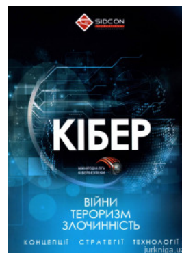
Кібервійни, кібертероризм, кіберзлочинність (концепції, стратегії, технології)

Перейти до галузі права Іноземна мова для юристів