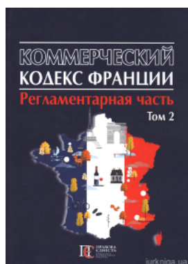
Коммерческий кодекс Франции. Регламентарная часть. Том 2