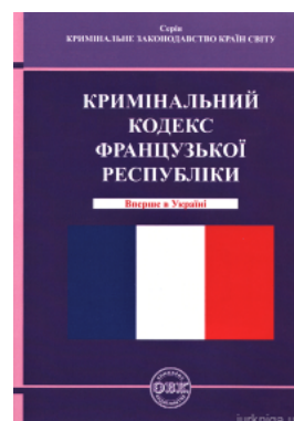
Кримінальний кодекс Французької Республіки