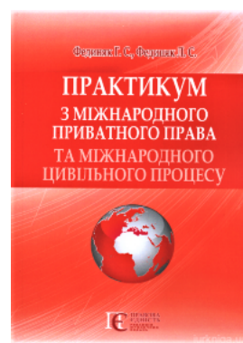
Практикум з міжнародного приватного права та міжнародного цивільного процесу

Перейти до галузі права Іноземна мова для юристів