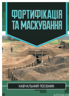
Фортифікація та маскування