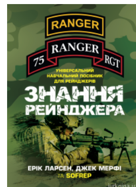
Знання рейнджера. Універсальний навчальний посібник для рейнджерів