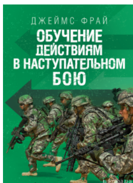
Обучение действиям в наступательном бою