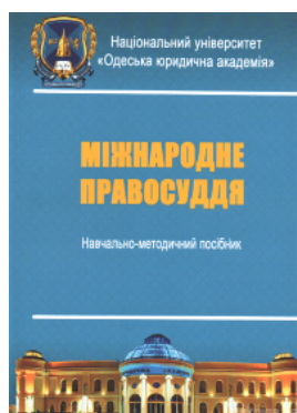
Міжнародне правосуддя. Навчально-методичний посібник