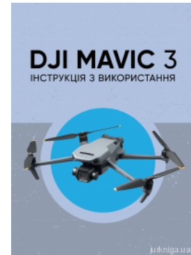
DJI MAVIC 3. Інструкція з використання