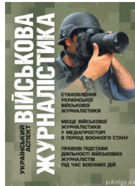
Військова журналістика. Український аспект: становлення української військової журналістики; місце військової журналістики у медіапросторі в період воєнного стану