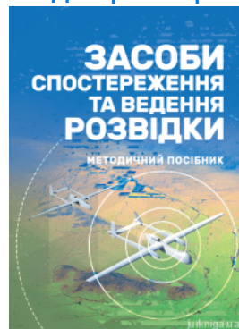
Засоби спостереження та ведення розвідки

Перейти до галузі права Міжнародне приватне право