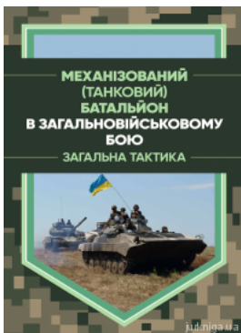
Механізований (танковий) батальйон в загальновійськовому бою. Загальна тактика