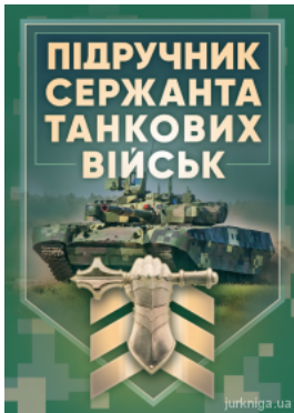
Підручник сержанта танкових військ Збройних Сил України