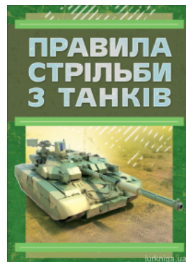
Правила стрільби з танків