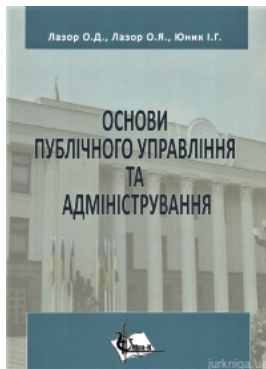
Основи публічного управління та адміністрування