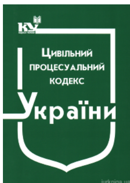
Цивільний процесуальний кодекс України