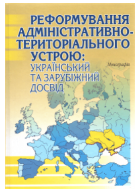
Реформування адміністративно-територіального устрою: український та зарубіжний досвід