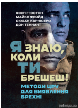
Я знаю, коли ти брешеш! Методи ЦРУ для виявлення брехні