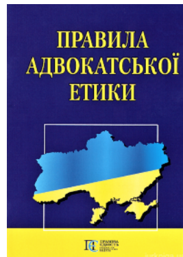
Правила адвокатської етики. Алерта