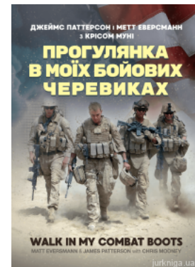
Прогулянка в моїх бойових черевиках