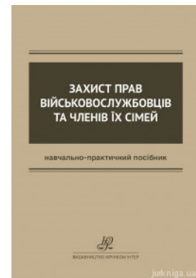
Захист прав військовослужбовців та членів їх сімей