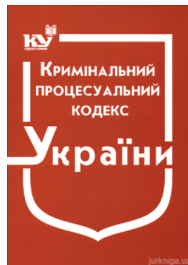
Кримінальний процесуальний кодекс України