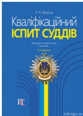
Кваліфікаційний іспит суддів: навчально-практичний посібник