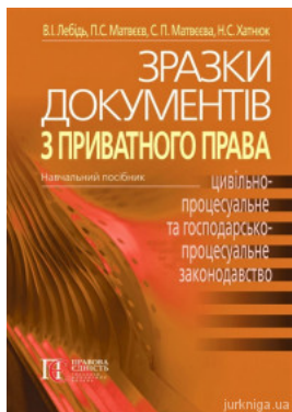
Зразки документів з приватного права (цивільне, сімейне, житлове, трудове, земельне, цивільно-процесуальне та госпо-дарсько--процес уальне...)