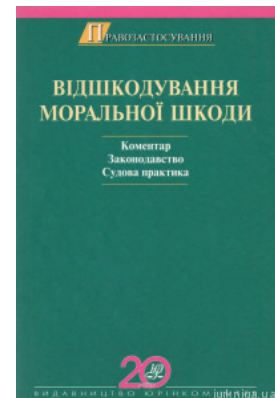
Відшкодування моральної шкоди. Коментар. Законодавство. Судова практика