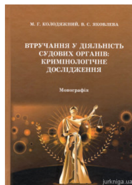
Втручання у діяльність судових органів: кримінологічне дослідження