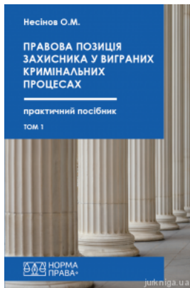
Правова позиція захисника у виграних кримінальних процесах. Том 1