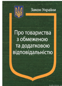
Закон України «Про товариства з обмеженою та додатковою відповідальністю»