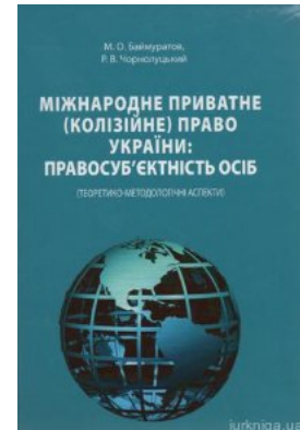
Міжнародне приватне (колізійне) право України: правосуб'єктність осіб (теоретико-методологічні аспекти)