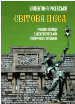
Світова п'єса. Правові явища в шекспірівських історичних хроніках. Видання друге