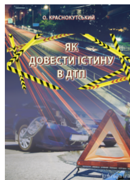
Як довести істину в ДТП

Перейти до галузі права Теорія держави і права