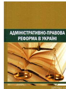
Адміністративно-право ва реформа в Україні