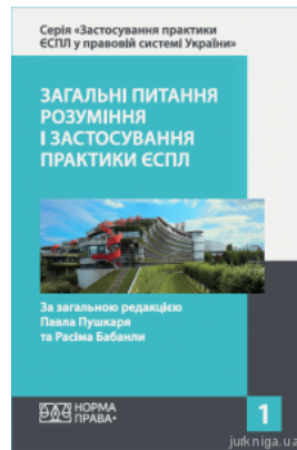
Загальні питання розуміння і застосування практики ЄСПЛ. Том 1