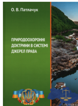
Природоохоронні доктрини в системі джерел права