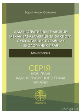
Адміністративно-правовий механізм реалізації та захисту суб'єктивних публічних екологічних прав