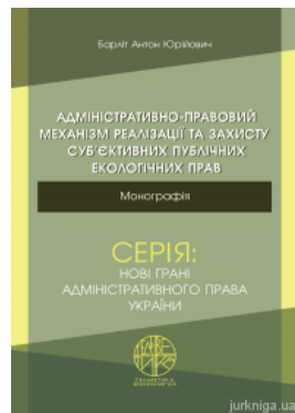
Адміністративно-правовий механізм реалізації та захисту суб'єктивних публічних екологічних прав