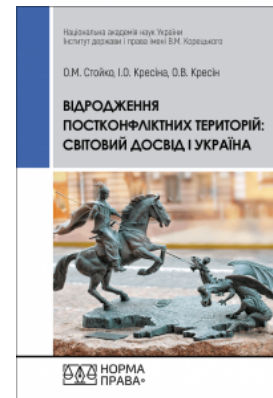
Відродження постконфліктних територій: світовий досвід і Україна