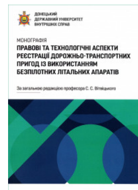
Правові та технологічні аспекти реєстрації дорожньо-транспортних пригод із використанням безпілотних літальних апаратів