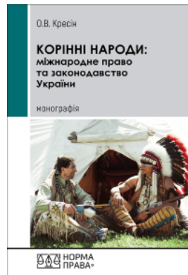
Корінні народи: міжнародне право та законодавство України