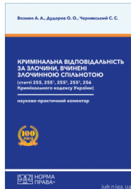
Кримінальна відповідальність за злочини, вчинені злочинною спільнотою (статті 255, 255-1, 255-2, 255-3, 256 Кримінального кодексу України)....