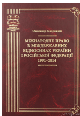
Міжнародне право в міждержавних відносинах України і Російської Федерації 1991-2014