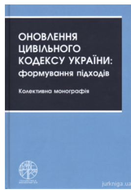
Оновлення Цивільного кодексу України: формування підходів