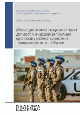
Міжнародно-правові засади миротворчої діяльності міжнародних регіональних організацій у контексті відновлення територіальної цілісності України