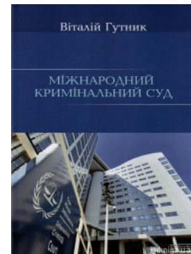
Міжнародний кримінальний суд