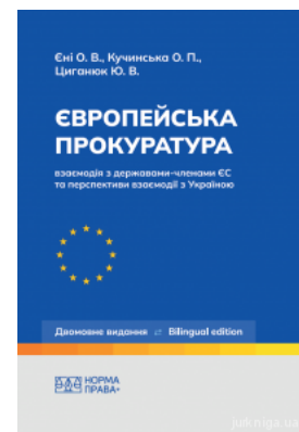
Європейська прокуратура: взаємодія з державами-членами ЄС та перспективи взаємодії з Україною

Перейти до галузі права Міжнародне право