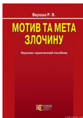
Мотив та мета злочину