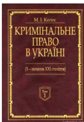
Кримінальне право України (X-початок XXI століття). У 2-х томах