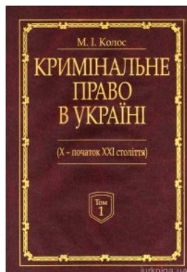
Кримінальне право України (X-початок XXI століття). У 2-х томах