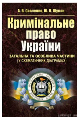
Кримінальне право України. Загальна та Особлива частини (у схематичних діаграмах)