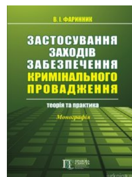
Застосування заходів забезпечення кримінального провадження: теорія та практика

Перейти до галузі права Кримінальне право та процес