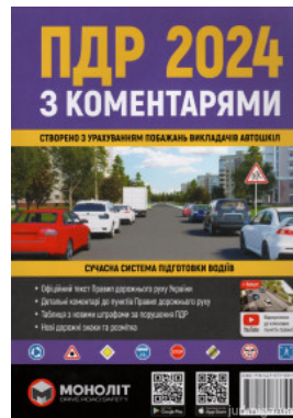
ПДР України 2024 з коментарями