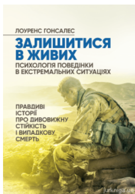
Залишитися в живих. Психологія поведінки в екстремальних ситуаціях. Правдиві історії про дивовижну стійкість і випадкову смерть