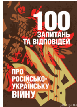
100 запитань та відповідей про російсько-українську війну