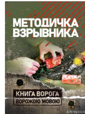
Методичка взривника. Книга ворога ворожою мовою