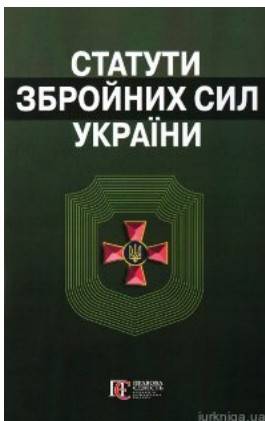
Статуты Збройних сил України. Збірник законів. Алерта