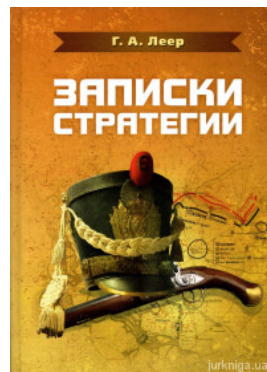
Записки стратегії. Репринтне издание