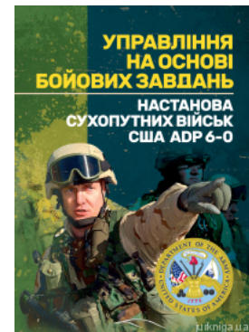
Управління на основі бойових завдань. Настанова сухопутних військ США