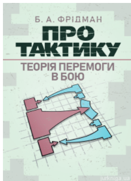
Про тактику. Теорія перемоги в бою