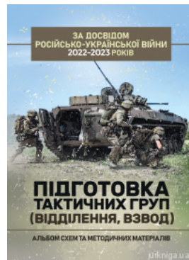
Підготовка тактичних груп (відділення, взвод). Альбом схем та методичних матеріалів