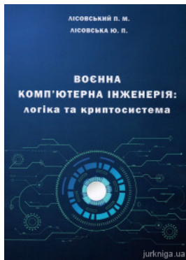
Воєнна комп'ютерна інженерія: логіка та криптосистема