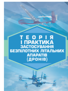
Теорія і практика застосування безпілотних літальних апаратів (дронів)