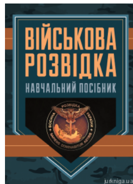
Військова розвідка. Навчальний посібник