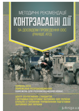
Методичні рекомендації "Контрзасадні дії" (за досвідом проведення ООС (раніше АТО))