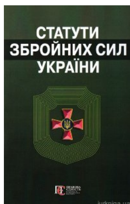
Статуті Збройних сил України. Збірник законів. Алерта