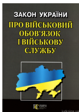
Закон України "Про військовий обов'язок і військову службу". Алерта