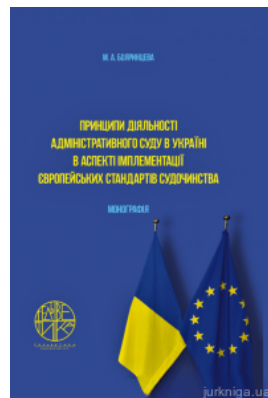
Принципы діяльності адміністративного суду в Україні в аспекті імплементації європейських стандартів судочинства